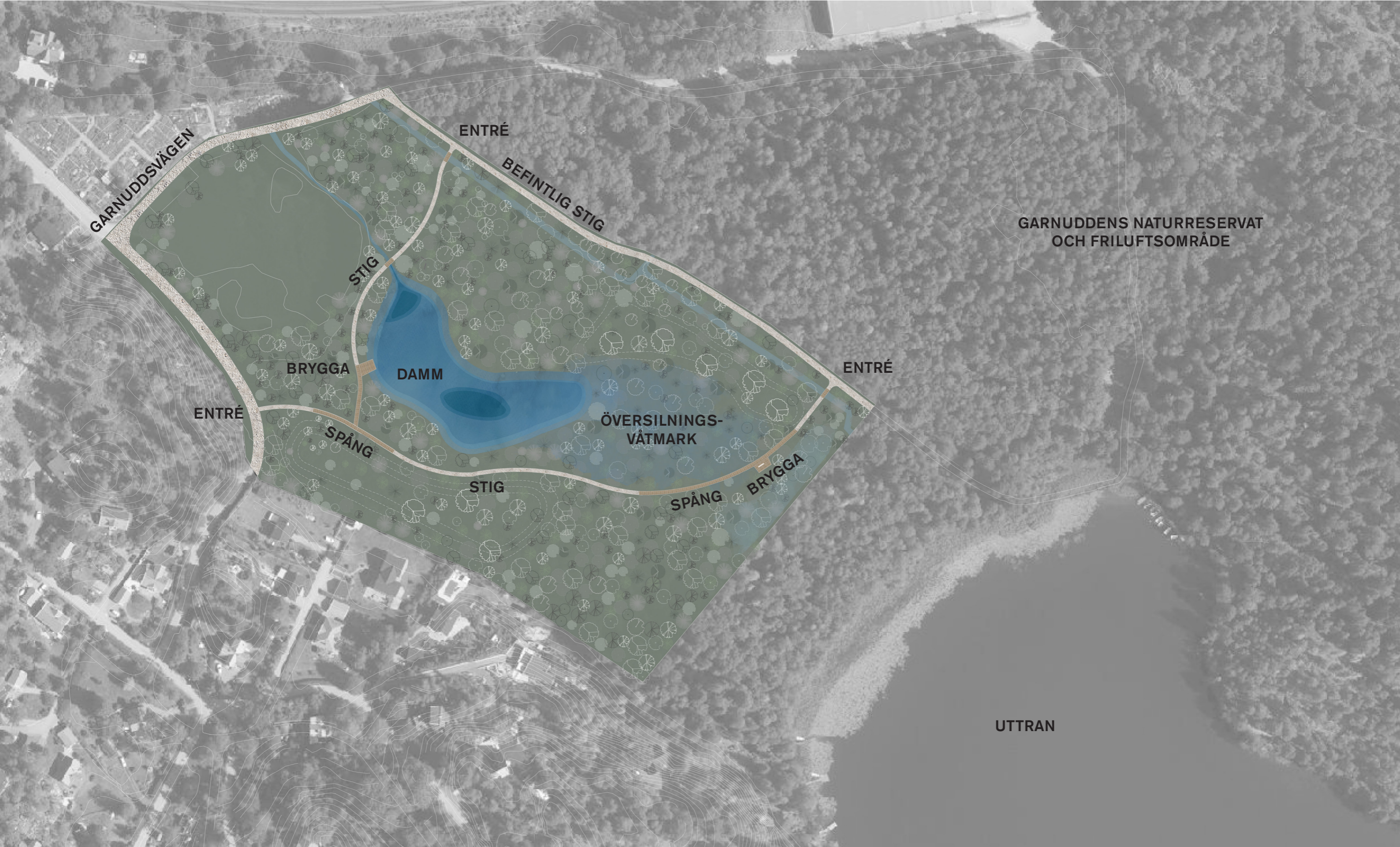
Illustrationsplan Garnudden 2020-11-25